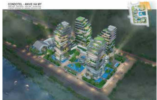
CONDOTEL - ANVIE HA MY DIEN NAM - DIEN NGOC - DIEN BAN - QUANG BINH CONCEPT DESIGNED BY LANDMAK ARCHITECTURE

Khu TMDV 12 tầng - Condotel có diện tích khoảng 7.763m 2 , được kết hợp nhuần nhuyễn giữa không gian xanh với khu nhà, biến nơi đây như một khu vườn trên cao, đảm bảo các dịch vụ tiện ích và vẫn đem đến những không gian tươi mát.