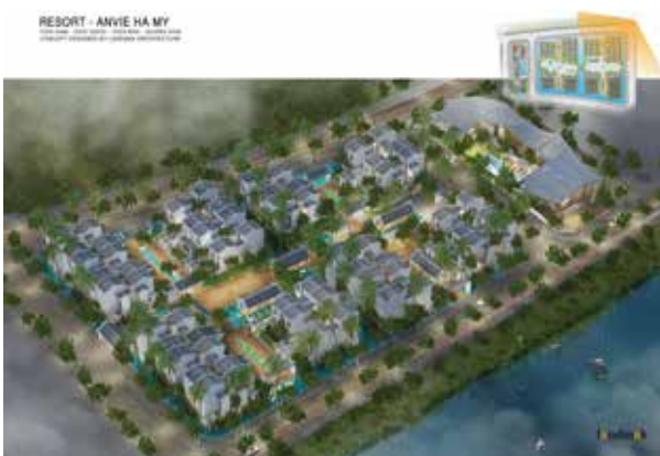
RESORT - ANVIE HA MY DIEN NAM - DIEN NGOC - DIEN BAN - QUANG BINH CONCEPT DESIGNED BY LANDMAK ARCHITECTURE

Khu Resort - 3 tầng, có diện tích khoảng 11.134 m 2 : Tái hiện hình ảnh một ngôi làng với mặt nước (con kênh) bao ngoài, các mái nhà, các sân sinh hoạt chung kết nối cộng đồng.