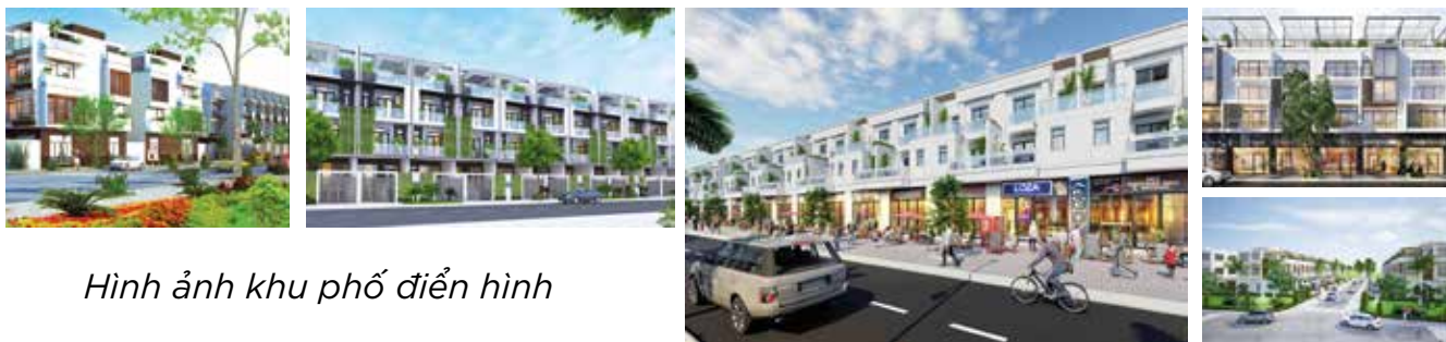
Hình ảnh khu phố điển hình